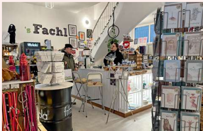
Im 's Fachl gibt es ein buntes Sammelsurium an Produkten

die sogenannten „Fachl“ als Geschenk- inspiration präsentieren und verkaufen lassen. Das 's Fachl Frankfurt bietet Verkaufsfäche in guter Innenstadtlage an (gleich um die Ecke von der Kleinmarkthalle), dadurch