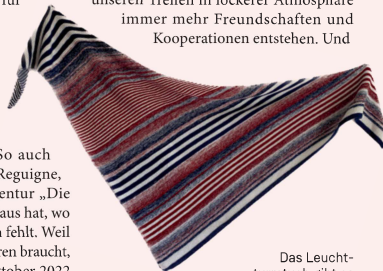
Das Leuchtturmtuch gibt es in verschiedenen Strickmustern